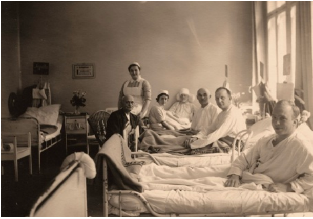
Abb. 3: Jüdisches Krankenhaus, Aufnahme vom 24.6.1934

Der Krankenhausbetrieb ging auch im Nationalsozialismus (NS) weiter, allerdings unter zunehmend schwierigeren Bedingungen. Im Juli 1938 wurde allen jüdischen Ärzten die Approbation entzogen. In der Folge kam die medizinische Versorgung durch den Weggang von Ärzten an ihre Grenzen.